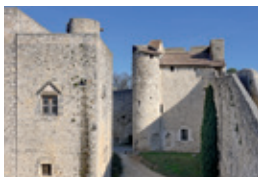
Château des Adhémar (Montélimar)