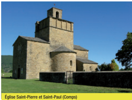
Église Saint-Pierre et Saint-Paul (Comps)

l'exil des protestants). Vous passerez à proximité de l'imposant château privé de Comps et de l'église romane aux proportions atypiques. Vous redescendrez ensuite en sous-bois vers Dieulefit.