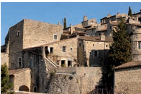
Village de Mirmande

du mistral et elle offre une végétation et une faune méditerranéennes qui méritent quelques arrêts. Marsanne est dominé par son village féodal situé sur les pentes raides (5 km) jusqu'au col de la Grande-Limite et ses grandes éoliennes. L'objectif est la visite du village perché de Mirmande qui abrita l'Académie d'été du peintre cubiste André Lhote (1885-1962) et la découverte de Cliousclat et de son ancienne fabrique de poterie. Le retour sur Grâne par les sources de la Tessonne est ponctué d'une dernière difficulté (environ 2 km entre 10 et 15%) qu'il ne faudra pas hésiter à franchir en poussant sa bicyclette et ainsi profiter des fleurs et des petits oiseaux.