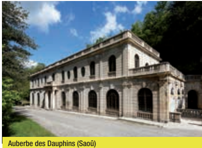
Auberge des Dauphins (Saoû)

dans les lacets du dernier kilomètre. La descente vers Aouste est très belle, avec notamment le ruisseau et le Pas de Lauzens, échancrure s'ouvrant sur la vallée de la Drôme. À peine arrivé en bas, il faut remonter en direction de La Répara, par une petite route qui serpente dans les coteaux secs. Un arrêt au hameau des Lombards est alors conseillé avant de s'attaquer à la dernière petite difficulté, la montée du petit col de Lunel. D'ici, il suffit de se laisser descendre dans la vallée du Roubion.