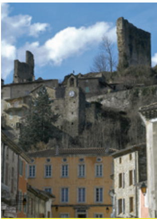
La viale (Bourdeaux)

Cet itinéraire emprunte des routes et des paysages sauvages, différents d'un col à l'autre. Blotti dans les Préalpes drômoises, Dieulefit (point de départ de l'itinéraire) est une cité touristique dont le climat est bénéfique pour les personnes souffrant d'insuffisance respiratoire. Découvrez au fil de votre parcours le château privé de Montjoux du 15 e siècle et plusieurs hameaux dispersés dans un paysage de montagnes et de lavandes. Du col de la Valouse, la petite route serpente dans un paysage lumineux au pied de Miélandre. La traversée des gorges de Trente-Pas offre un point vue du col de la Sausse sur la vallée du Roubion et la montagne d'Angèle. Dominant la route conduisant à Crupies, la chapelle d'origine romane Saint-Jean s'inscrit harmonieusement dans le paysage. La traversée de Bourdeaux est l'occasion de faire une halte afin de découvrir le vieux village (la Viale) à travers un itinéraire historique et patrimonial.